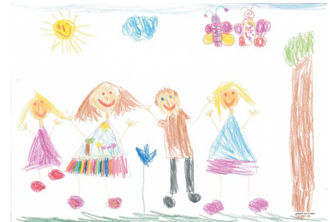
gemalt von Lotte

Weitere Informationen zu den einzelnen Kindertagesstätten erhalten Sie unter www.papenburg.de