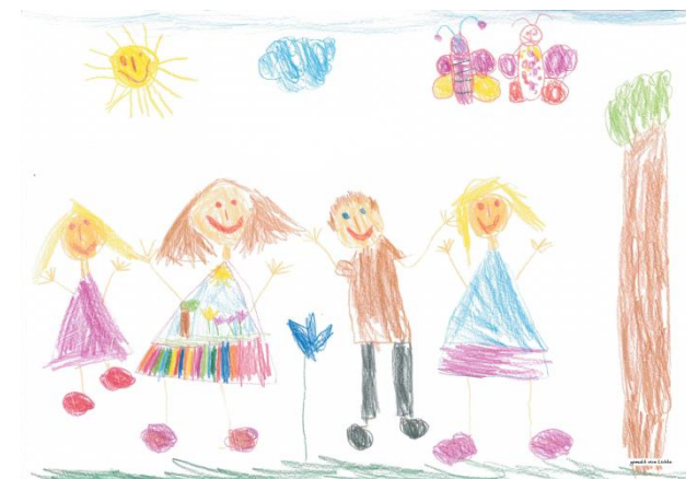
gemalt von Lotte